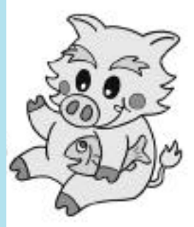
マスコットキャラクター