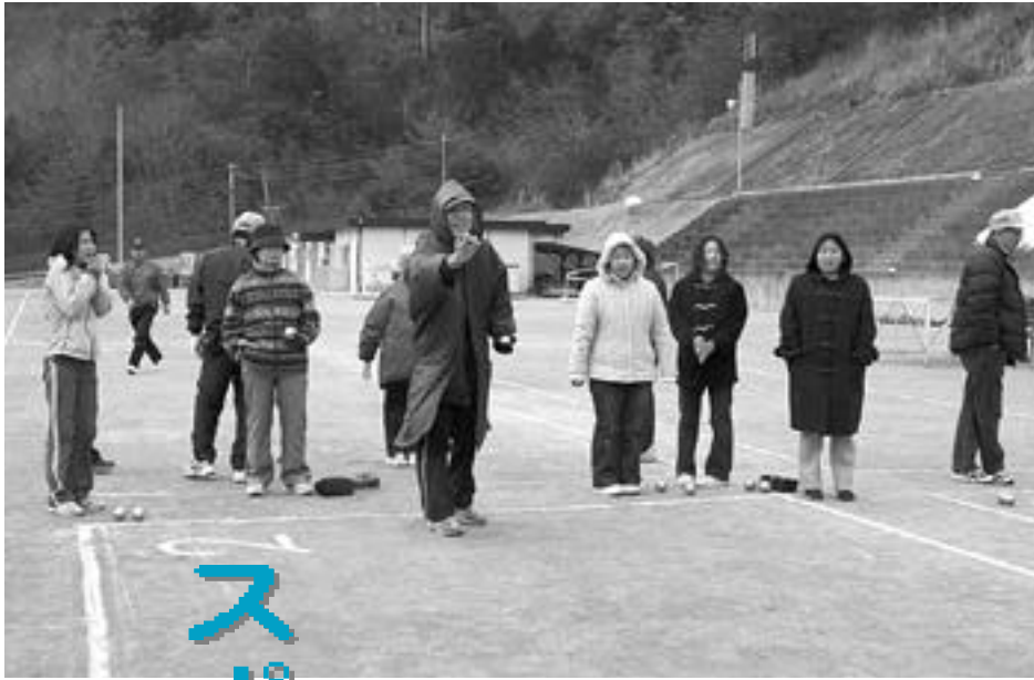
スポーツクラブ21交流大会でバタンクを楽しむ参加者

人口：31,689 (+59) 男：15,336 (+35) 女：16,353 (+24) 世帯：10,915 (+48) (平成19年4月1日現在)