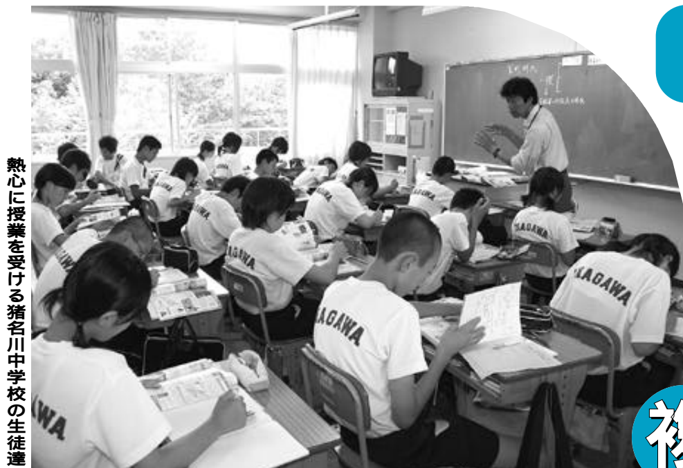
熱心に授業を受ける猪名川中学校の生徒達

人の動き 人口 : 31,820 (+23) 男 : 15,376 (+14) 女 : 16,444 (+9) 世帯 : 11,014 (+24) (平成19年7月1日現在)