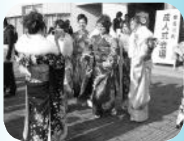
昨年の成人式の様子