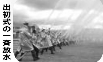
出初式の一斉放水