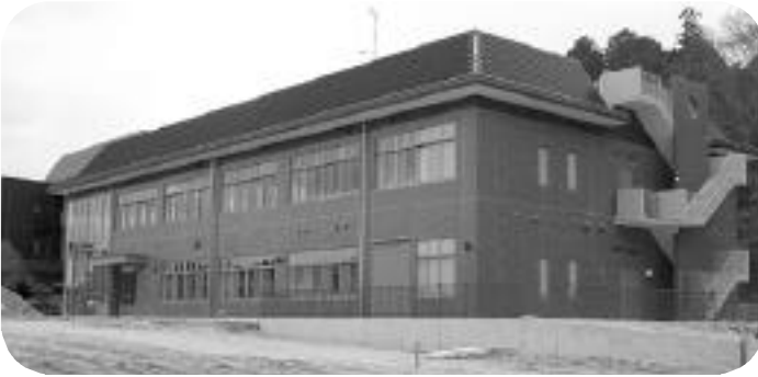
完成した水道庁舎

これまでの災害時に ける観測データでは、雨 量・河川水位の個々のデ ータのみで、どこまで浸 水するか予測しにくい