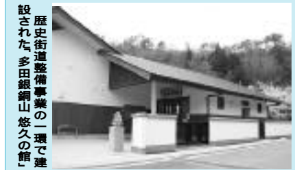
歴史街道整備事業の一環で建設された、多田銀銅山悠久の館