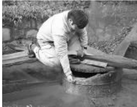
杉生の源泉(奥猪名健康の郷)

猪名川の温泉 寒い日々が続きます。暖房設備が不足した時代には、庶民は寝間にわらを敷き夜間の寒さを防ぎました。そんな夜、入浴は体を温め疲れを癒す何よりの楽しみだったでしょう。しかし、風呂を沸かすには井戸や川からの水汲みが必要で、また薪も無駄にはできない時代、熱い温泉が湧く地域以外では、毎日入浴できるものではなかったのです。さて、町域にも温泉(冷泉)があちこちで湧き出しています。享保14(1729)年の「木津村明細帳」には「往古より温泉候えども、川辺郡平野村へ沸き替へ、只今は御座なく候」とあり、木津にも温泉があったことがわかります。