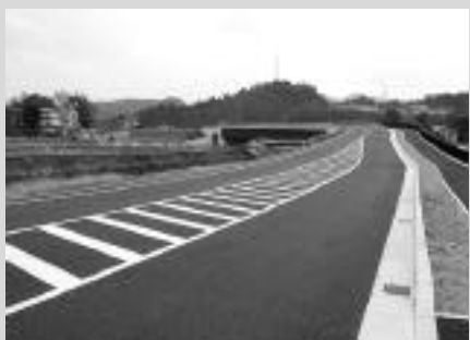
南田原地内のバイパス区間

県道川西篠山線の紫合北ノ町交差点から北田原東口間の安全性を図ることを目的に、平成15年度から周辺関係自治会の協力のもと整備を進めていた北野バイパスが5年の歳月を経て完成しました。