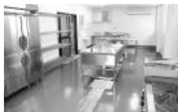
新しくなった加工室

募集内容 加工施設の愛称 募集期限 3月14日(金)必着 応募資格 町内在住・在勤・在学の人 応募方法 ハガキ・Eメール・FAXのいずれかに、愛称・理由・名前・住所・電話番号を明記し、農林商工課 選考