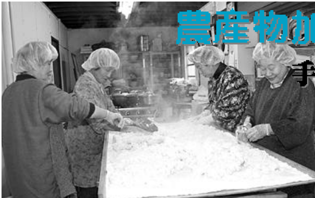
蒸した米にこうじ菌を混ぜて味噌を作るいなの郷グループの皆さん

人の動き 人口：32,240 (+17) 男：15,582 (+7) 女：16,658 (+10) 世帯：11,207 (+11) (平成20年2月1日現在)