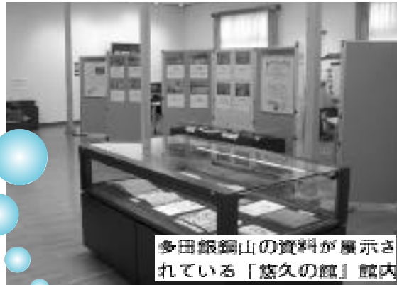
多田銀銅山の資料が展示されている「悠久の館」館内