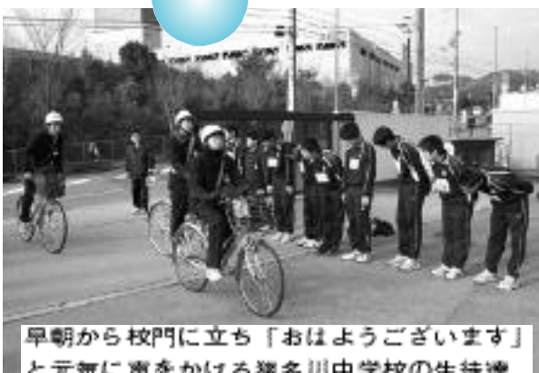
早朝から校門に立ち「おはようございます」と元気に声をかける猪名川中学校の生徒達

住民と行政の協働によるまちづくりの推進母体となる「地域まちづくり協議会」の組織設立や事業活動に対する支援、地域社会の連帯感を強め、明るく安全で住みよい地域社会づくりのため、大人や子どもがお互いに「声かけ」や「あいさつ」を励行する「いなースマイルあいさつ運動」の推進、団塊世代の生きがいづくりとして講座やフォーラム、農業体験を行います。また、平成23年7月の地上デジタルテレビ放送への完全移行を控え、町内全域のデジタル波の受信状況調査経費などとなっています。