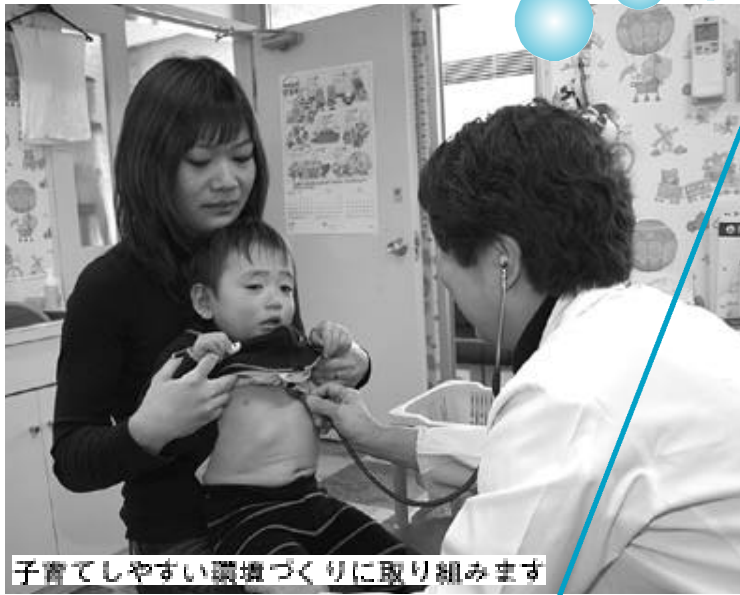
子育てしやすい環境づくりに取り組めます

なっています(円グラフ1)。歳入の目的別の構成では、民生費が22.0%を占め、続いて教育費が16.2%、公債費が15.8%、総務費が15.4%の順になっています(円グラフ2)。 また、性質別の予算割合は、人件費・公債費・扶助費といった義務的経費が前年度比7.1%増の43億6301万3千円となっており、学校の整備や道路の整備といった投資的経費は、楊津小学校改築の完了などにより4億734万8千円で前年度比57.3%減となっています。