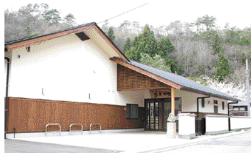
多田銀銅山悠久の館(銀山)

銀山町を描いたこの3枚の絵図と、発掘調査の進む銀山地区の「多田銀銅山遺跡」との一致点かなり確定