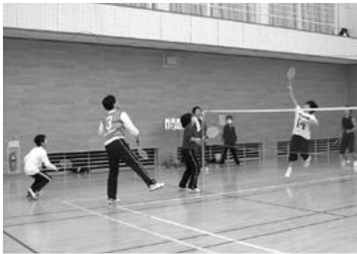
ファミリーバドミントンを楽しむ参加者

町内では、スポーツや文化交流を通 して地域コミュニティの活性化を図る ため、7小学校区すべてにスポーツク ラブ21が立ち上がっています。 皆さんも地域の人達と一緒に、心地 よい汗を流してみませんか。