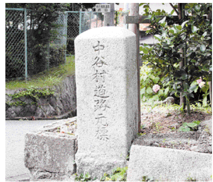
中谷村道路元標(広根)

結ぶ篠山街道は改修が進み、屏風岩の上を通っていた道も崖下に移設され、新道ができました。しかし、増水時に通行できなくなるのが再三あったため、昭和の初めに車が通れなかつた屏風岩横の板橋を架けかえ、バスやトラックが通行できる道にしました。当時の六瀬村道路元標が木津橋北に、中谷村道路元標は広根警察署跡近くに残されています。