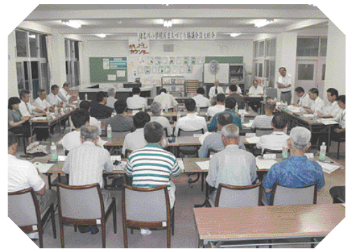
地域の課題は地域で解決

6月29日、つつじが丘小学校区と猪名川小学校区の2校区で「地域まちづくり協議会」が発足しました。両協議会では、今後、地域の福祉・環境・防災・防犯などの課題を、関係機関と連携しながら協議していきます。