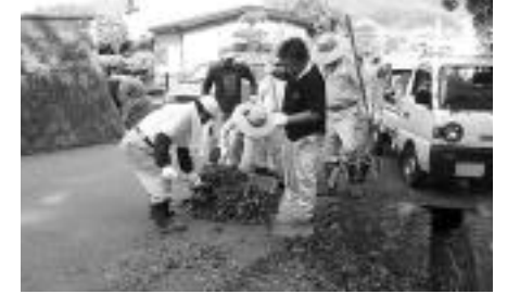
社会福祉会館周辺の道路を清掃する北野自治会の皆さん

町内各地域で、8月の道路ふれあい月間にあわせて、道路愛護活動が行われています。期間中、約40自治会が公園や自治会館などとともに道路の清掃にあたります。8月10日、北野自治会では約30人が、県道川西篠山線・社会福祉会館周辺の道路清掃を行いました。参加者は、道路脇の草を草刈り機で刈ったり、溝にたまっている落ち葉を集めるなど力を合わせて清掃し、地区を通る道路は北野自治会の皆さんの手できれいになりました。地域で清掃活動が行われる際には、皆さんもぜひご協力ください。