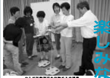
からだ年齢測定を体験する支援員