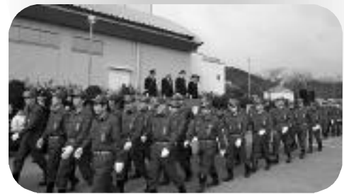
出初式での観閲行進