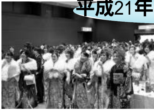
昨年の成人式の様子