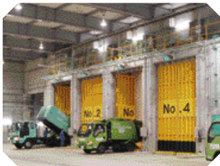
ピットにごみを搬入する収集車

リサイクルプラザでは、資源ごみを選別・圧縮などの処理を経て、資源として活用します。