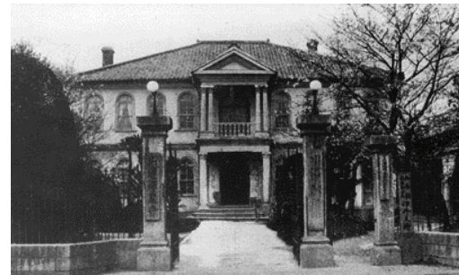
往時の川辺郡役所(現伊丹市宮の前)

(現尼崎市)、高平(のち有馬郡。現三田市)の17村と伊丹町、尼崎町で構成されました。 大正から昭和初期には尼崎市(尼崎町と立花村の一部)伊丹市(伊丹町と稲野村)が発足、昭和の大合併で近隣地域は全て市制を施行、1郡1町の猪名川町が誕生しました。