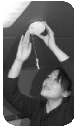
家庭でも簡単に設置できます

火災による死 者をなくすため、 住宅用火災警報 器の設置が義務 付けられました。 新築住宅ではす でに設置されて いますが、既存 住宅は平成23年 5月31日までに 寝室などに設置 しなければいけ ません。火災による被害から身を守 るため、早期に住宅用火災警報器を 設置しましょう。 問い合わせは、消防本部(766-0119)へ。