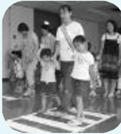
幼児 交通安全ルールを学ぶ

幼児の交通事故防 止を目的とした「幼 児交通安全クラブ (愛称うさちゃんク ラブ)」の平成21年度会 員を募集します。同 クラブでは、指導員 のお姉さんとゲーム やビデオで信号や横