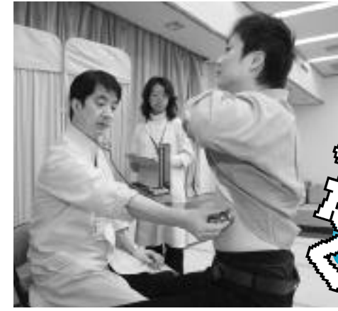
定期的に健康診断を受けましょう

個別検診を希望する人は、川西市内の医療機関で受診してください。集団健診での受診を希望する人は、希望項目に必要な事項を記入し、同封の返信用紙で返信してください。申込書は世帯に1枚となりますので、ご注意ください。