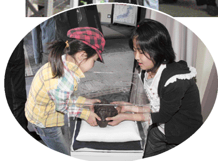
約7.4kgの隕石を持ち上げられるか挑戦してみてください

9月19日・10月14日 17日・11月19日 12月19日 いずれも土曜日の午後6時30分 望遠鏡使用方教室 天体望遠鏡の仕組みから使い方まで学べます。 とき 5月2日(土)午後5時~同9時30分 土星大観望会 土星の輪をみよう。 とき 5月3日(日)午後6時30分 日(水)午後6時30分 日(水)午後6時30分 中止・申込不要