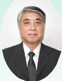
佐伯生活安全 アドバイザー