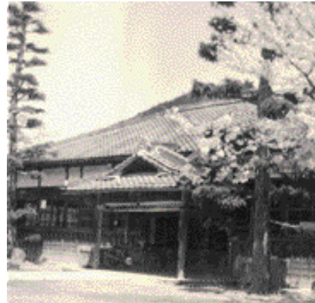
昭和23年当時の六瀬村役場(笹尾)