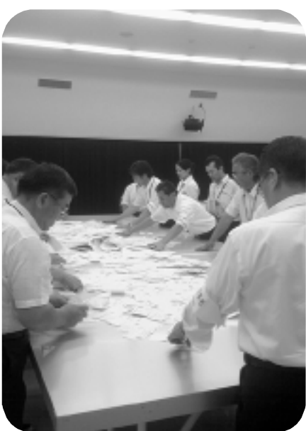
あなたの貴重な一票を国政に生かしましょう