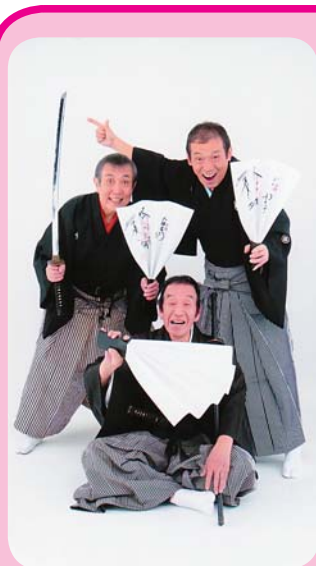
▲チャンバラトリオ(殺陣漫才)