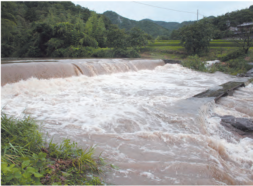
▲豪雨で増水するふるさと館裏の川

〒666-0292 兵庫県川辺郡猪名川町上野字北畑11-1 電話番号 072 (766) 0001 (代表) ファックス番号 072 (766) 3732