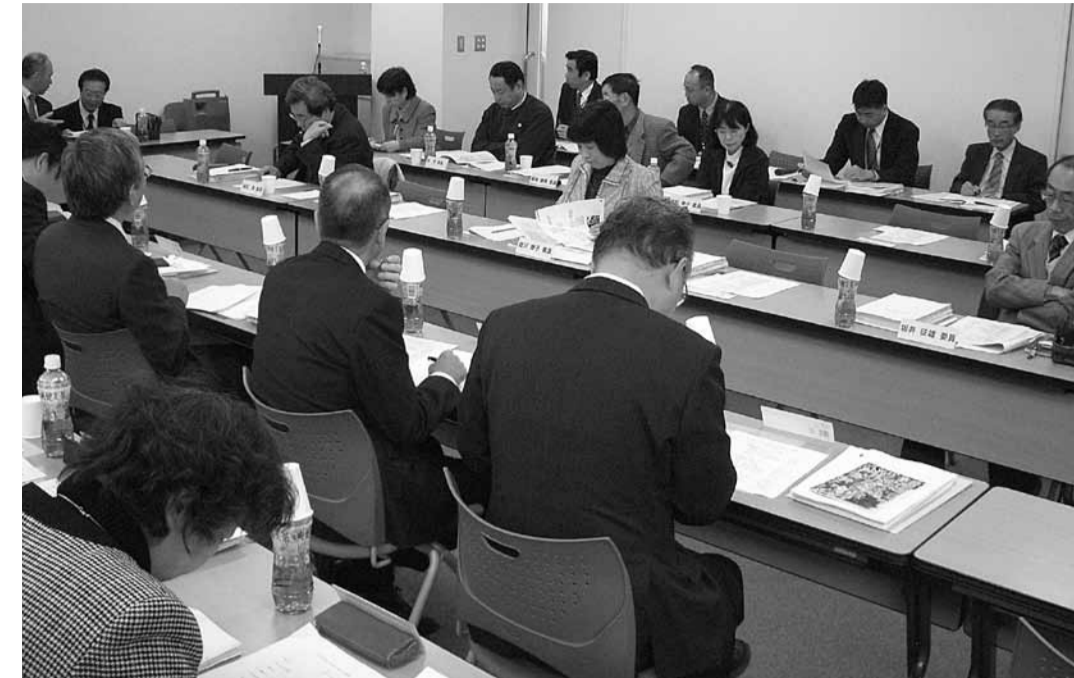
▲総合計画審議会の様子

第五次猪名川町総合計画(案)について、7月15日から8月14日までの間、その案を公表し、皆さんの意見を募集しました。その結果、寄せられた意見の概要は次のとおりです(提出意見:4件18項目)。また、意見に対する町の考え方をお知らせします。問い合わせは、企画財政課(☎766-8711)へ。