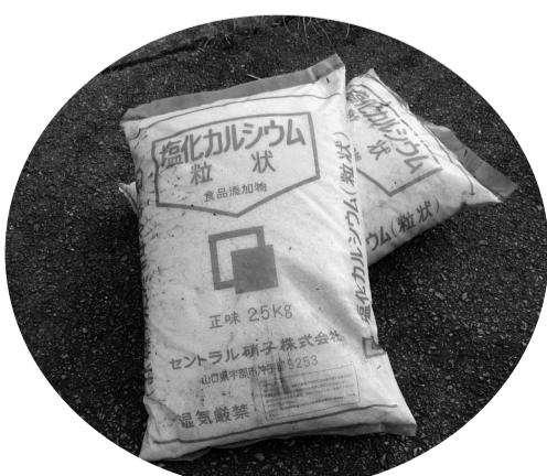
▲道路脇などに設置した凍結防止剤

町では、冬季の道路管理として、降雪時に主要な幹線道路を中心に凍結防止剤を散布しています。しかしすべての道路にまらなく散布することは困難です。凍結防止剤を道路端などの適所に配置しています。