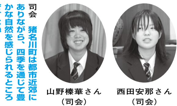
司会 猪名川町は都市近郊にありながら、四季を通じて豊かな自然を感じられるところですね。

町長 そうですね、皆さんもよくご存知のことだと思いますが、町域の8割を山林が占めています。この豊かな自然は、本町が誇る大切なものだと考えており、これからも自然を大事にするまちづくりを行いたいと考えています。