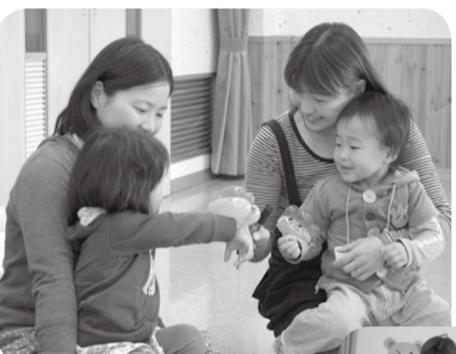
▲初対面でも、催しなどをとおして親子同士が仲良くなれます

町長 少子化問題のなか、新しい希望の誕生は、とても素晴らしいことです。町長 本気で喜ばしいことですね。医療技術が進んだ現代において、子どもは授かりの宝物です。みなさんにとっても猪名川町にとっても、大切な宝物です。司会 それでは、みなさんにお話を伺っていきませんか？