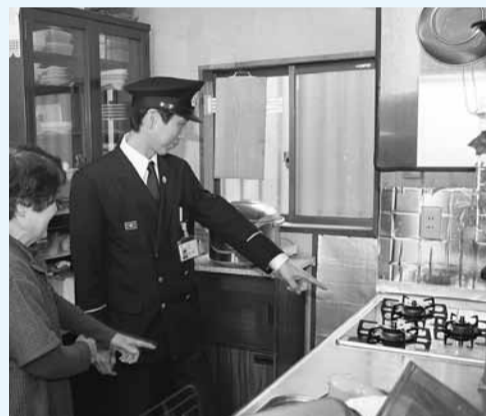
▲昨年の住宅防火診断の様子

3月1日から同7日まで、全国一斉に春の火災予防運動が行われ、その一環として猪名川小学校区の各自治会の高齢者世帯(65歳以上の世帯)を対象に住宅防火診断を実施します。希望者は2月21日(月)までに、各地区の民生委員・児童委員にご連絡願います。