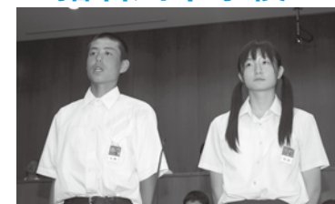
「安全安心」 と言える道