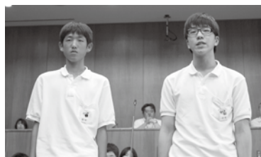
被災地への ボランティア 活動と町民 全体での防 災訓練につ いて