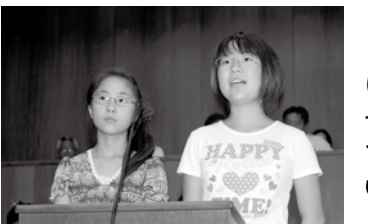
みんなが幸 せに過ごせる 暮らせる町を 目指して震災 に負けない 町づくりを