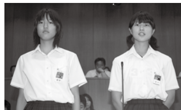
街灯の設置 について