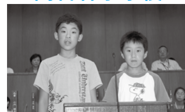
阿古谷の ホテルを 守るた めに