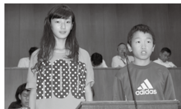
猪名川町 明るい未来 へ