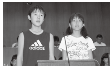
ペットボ トルのキャ ップを集め よう