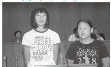
食べるもの を大切にす る気持ちを 大切にほし い！