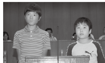
安全・安心 できる町づく りを