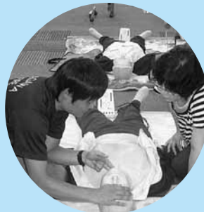
▲昨年のフェアの様子

①地方公務員法第16条の欠格条項に該当する人は、応募できません。②受験者が平成24年3月31日までにその属する学校を卒業できない場合、または必要な専門課程の修了や資格の取得ができない場合は、採用できません。③受験申込みは、1職種に限ります。また、受付後の職種の変更は認めません。