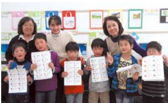
自分だけの作品ができました

新学期に向けて、ネームシールやアイロンプリントなどをパソコンで作る教室です。春休み中に開催され、この日は小学1～3年生までの6人の子どもたちが参加しました。