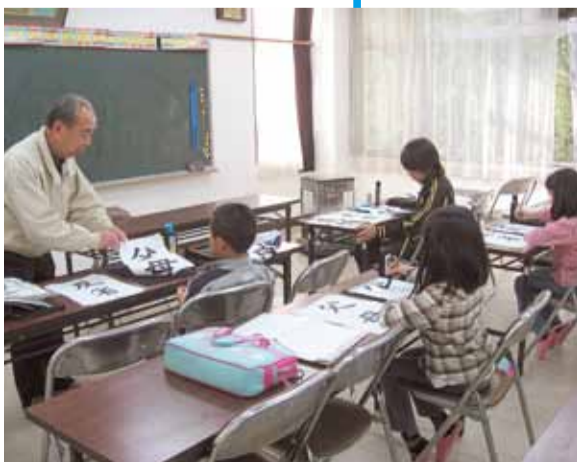
丁寧な指導を受ける子どもたち

小学3～6年生を対象にした月3回の習字教室です。硬筆と毛筆の両方を習いますが、この日は毛筆の練習でした。先生が配られる「永」「父母」「努力」などのお手本を見ながら、筆を持ちていねいに半紙に書きます。