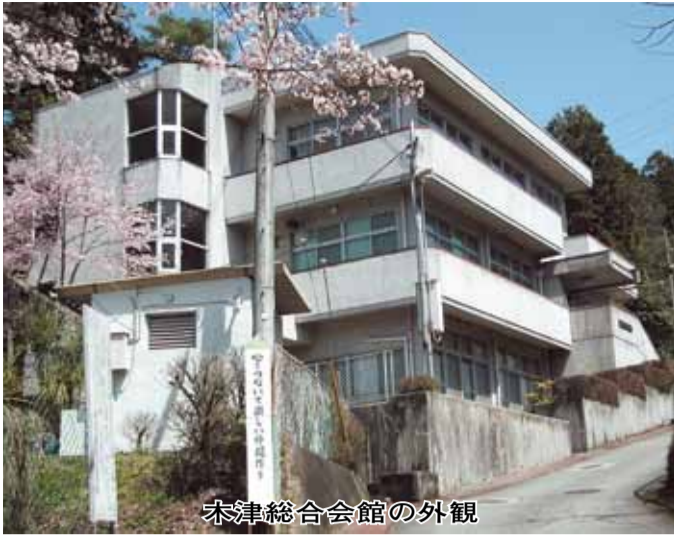
木津総合会館の外観