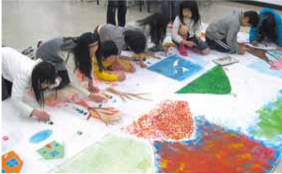
自由に描く子どもたち