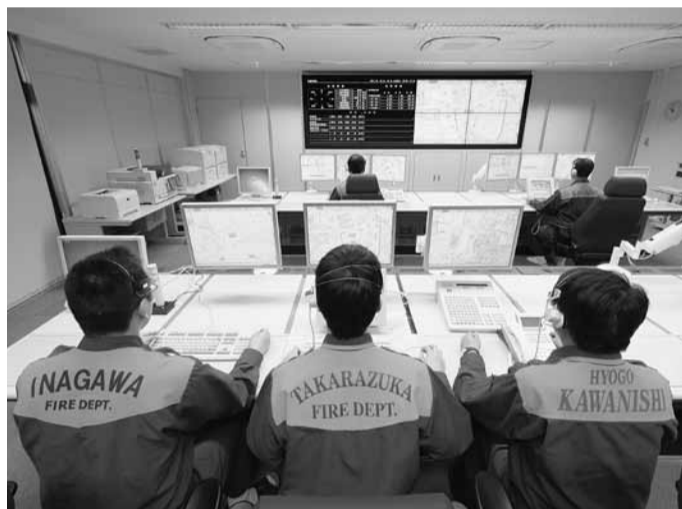
▲指令センターで業務を行う2市1町の消防署員

宝塚市・川西市・猪名川町の2市1町では、消防通信指令業務の効率的な運用を目的として4月1日から消防通信指令業務の共同運用を開始しました。