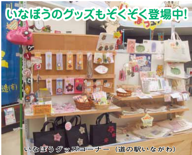
いなぼうグッズコーナー (道の駅いながわ)

「いなぼう出沒マップ」があります。タイトルをクリックするといなぼうの出沒する場所を教えてください。さらに「同トップページにある「GO!GO!いなぼうレポート」では、いなぼうの活躍が確認できます。