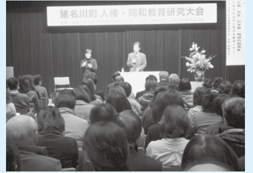
▲昨年の大会の様子