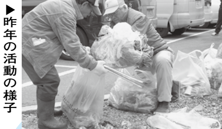
▶昨年の活動の様子

①民田川内猪名川漁協「川の案内所」・午後1時～(受付:同0時30分) ②林田川内林田川内グリーンランド入口・午前10時～(受付:同9時30分) ※雨天の場合 民田川内中止、林田川内同5日(日)に順延