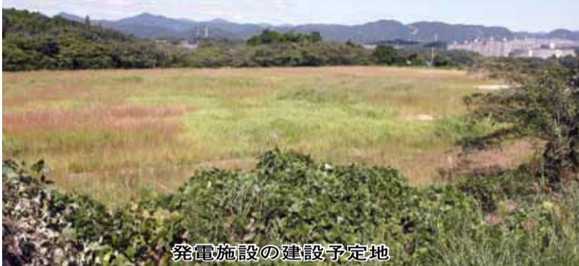
発電施設の建設予定地