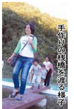
手作りの栈橋を渡る様子

今年度は、保全活動の拠点として、同会メダカ部会とともに、北プール跡地（笹尾地内）の小プールをメダカの飼育場所として整備し、10月3日に里親が各家庭で繁殖させたメダカを放流しました。今後、環境教育などの活動拠点としての活用を予定しています。