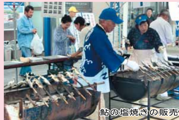
鮎の塩焼きの販売

また、観光ボランティアガイドによる周辺の景勝地「屏風岩」などのミニガイドも行っていますので、ご参加ください。