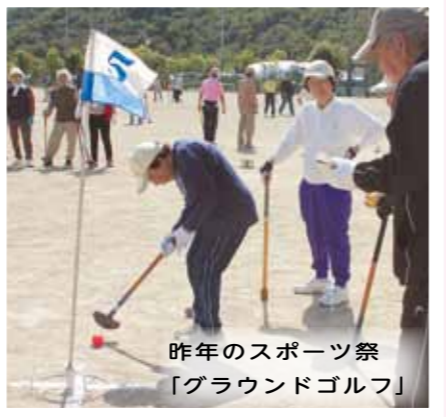
昨年のスポーツ祭 「グラウンドゴルフ」

見る人も、参加する人も楽しむことができ、一体感も生まれます。活動に参加した人たちは、皆さん、笑顔になり、活力を得て帰っていきま