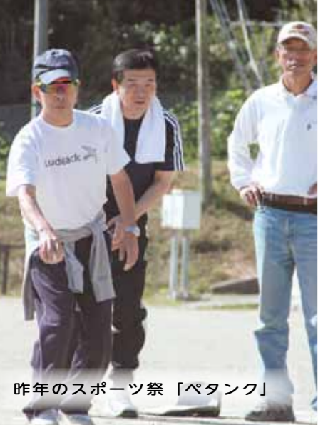
昨年のスポーツ祭「ペタンク」

「[SUNSHINE]「みんなで」だれでも」が、気軽にスポーツが楽しめる環境を推進し、世代や性別を超えて皆さんが様々なスポーツに親しめるよう、各地区や団体などにも出向