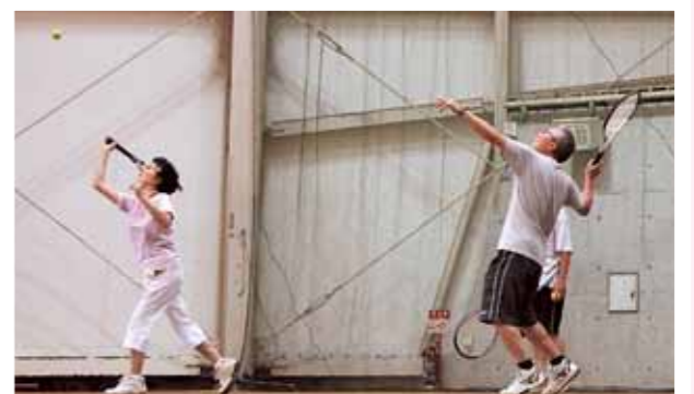
▶このページの問合せ ゆうあいセンター (☎ 766 - 1200)

テニスや水泳の後には、ゆったりとお風呂に入るのも、皆さんの楽しみの一つです。適度な運動とリフレッシュで、皆さん実年齢には見えない若々しさや「健康」を維持されています。