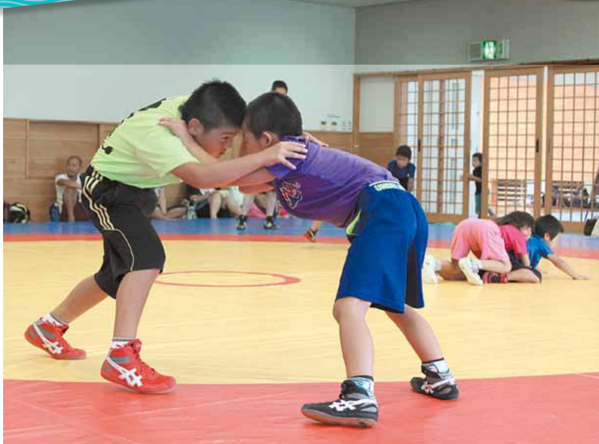
猪名川町からオリンピック選手を!(町レスリング協会)