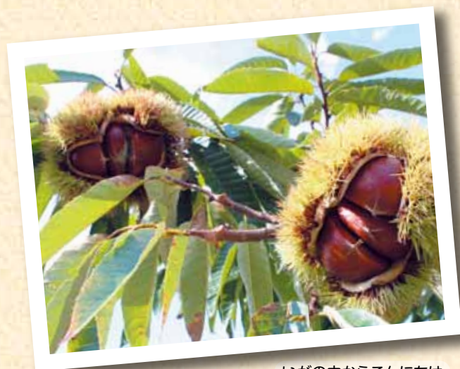
いがの中からこんにちは