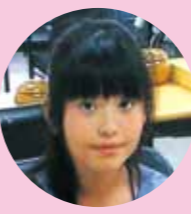
猪名川中学校 1年生

大会では日本と韓国の考え方や打ち方の違いに驚きましたが、ルールは一緒なので言葉がわからなくてもお互いに真剣に対戦し成長を感じることができ、異国の人と楽しめる囲碁の素晴らしさを実感できました。この体験をもとに、いろんな打ち方を混ぜ合わせられるように努力して力をつけ、来年も同大会に参加できるように頑張りたいと思います。