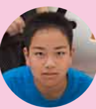
猪名川中学校 2年生