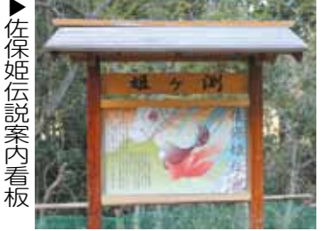
佐保姫伝説案内看板

かと私は想像しています。遠国に赴任した夫がやつのことで帰ると、妻が痩せ衰え、今にも死にそうに悩み苦しんだ姿を見て、帰国したらふたりで仲良く暮らそうと安易に考えていた自分を後悔し、「かくのみにありけるものを 猪名川の沖を深めて 我が思へりける」と詠みました。妻は臥した枕から頭をあげて、こんなにも恋焦がれる私の思いが通じたので、貴方はこの雪の降る中もいとわす帰ってきてくださいと、一ぬば玉の黒髪濡れて 沫雪の 降るにや来ます ことだ恋ふれば」と応えて詠みました。ゆっくり歩いて1時間、四季折々の川辺の景観を楽しみながら、古代のロマンに想いをはせるのも楽しいと思います。