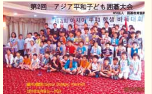
▲大会参加者で記念撮影

私たちは、「こどもパークつじが丘」の囲碁教室に通い、碁の打ち方を学ぶとともに、よく考えることを通じて集中力を養い、礼儀正しい所作も身に付けられるように頑張っています。今年の8月18〜21日に韓国で開催された第2回アジア平和子ども囲碁大会に、国内の選考予選を勝ち抜いて、日本代表として参加しました。異国の地でドキドキしましたが、その時感じたことやこれからの抱負などについてお話しします。