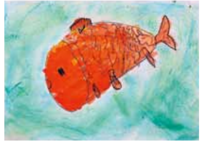
竹尾 雲さん(年少) ▶むしせよつちえんにいるぎんぎよをかいたよ!