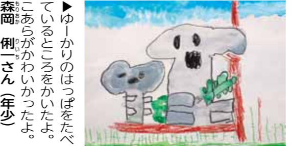
森岡 俐一さん(年少) ▶ゆーかりのはっぱをたべているところをかいたよ。こあらがかわいかったよ。