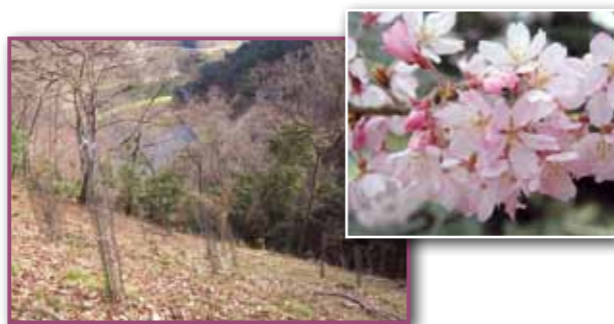
▲エドヒガン(内馬場の森)

明治の神仏分離の影響で少なくなったと思われるが、町内には今もなお十数カ所に山の神の祠が大切に祀られています。