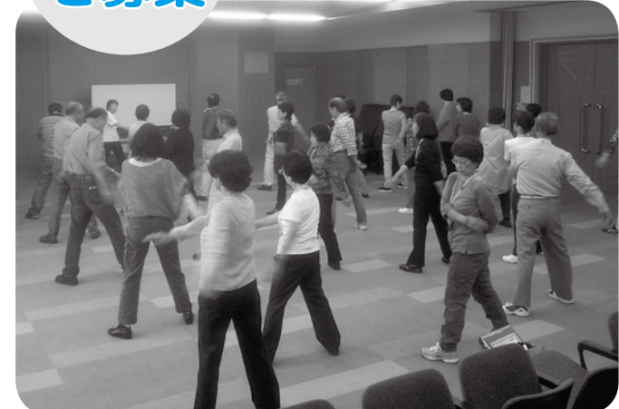
◀◀これまでに開催された講座の様子

講座では、歴史の中に、人々の楽しみ方や生活を見つめ、生きることの楽しさを学びます。私たちの住む猪名川町の歴史や文化も、日本の歴史全体の影響を受けずにはられません。長い日本の歴史を猪名川流域や阪神間地域とも関連付けて探ります。