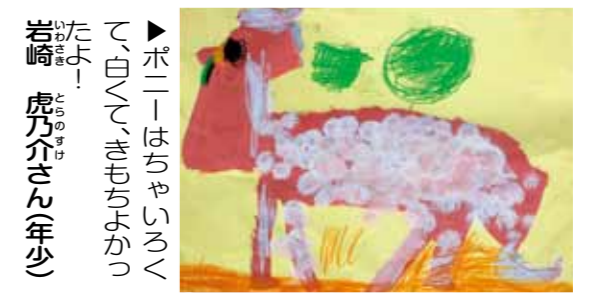
▶ボニーはちやいろくで、白く、きもちよかつたよ！ 岩崎 虎乃介さん(年少)