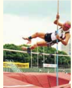
それを毎日、秋の県大会80歳以上のクラスの60m・100mで一位となりました。それがきっかけで専門書を片手に練習を続け、現在の私の実力となっています。

私は化学繊維会社を55歳で定年退職後、総合商社の子会社に再就職して15年間勤務し、70歳で依願退職しました。さて退職したものの毎日が日曜日、当時の男性の平均寿命は76歳と伝えられている時代、自分の余命の心細さに気づき、「なにか運動を」と考えていました。