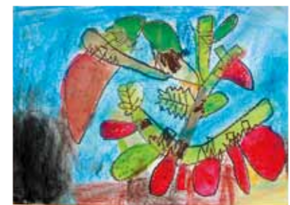
▲大きなイチゴ、まっかなイチゴ、かわいいイチゴができました！ 田島 諒也さん(年長)