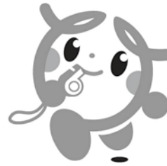
イメージキャラクター「マモリン」

日常生活の中で異変を察知した際に、匿名でも気軽に通報できる電話相談窓口を、兵庫県と兵庫県警察が共同で開設しました。