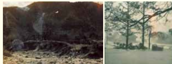
▲清水東側より尾花橋下流護岸耕地流失