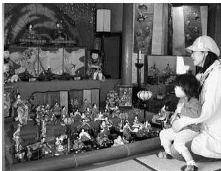
▲昨年のおひなまじりの様子

静思館で4月3日~同8日まで開催される毎年恒例のおひなまじりのボランティアスタッフを募集します。 ▼内容 ひな人形の飾りつけと収納、ディスプレイに使用する青竹の切断・加工、その他関連する作業 ▼期間 準備=3月6日(火)~4月2日(月)、後片付け=4月10日(火)~同12日(木) ▼申込締切 2月18日(土) ▼申込・問合せ 文化協 会(☎FAX766・013、火・木・土曜日午後に対応)