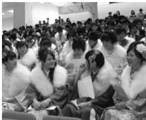
▲昨年の成人式の様子

多くの新成人の出席をお待ちしています。 ▶とき 1月9日(祝) 午前10時~(受付=午前9時15分~) ▶ところ 文化体育館(イナホール) ▶対象者 平成3年4月2日~平成4年4月1日生まれ ▶内容 第1部=式典、第2部=若人の集い(漫才、ビンゴゲーム、ビデオレター、軽食など) ▶問合せ 生涯学習課(☎767-2600)