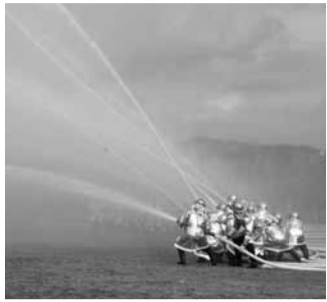
▲昨年の出初式の様子

新年恒例の「消防出初式」を開催します。当日は消防車両による行進、消防隊員による消防演技、消防団による一斉放水などを行います。ぜひ家族そろってご覧ください。 ▼とき 1月8日(日) 午前9時30分(雨天時は式典のみ) ▼ところ 文化体育館・総合公園 ▼内容 式典および消防署・消防団などによる行進や演技 ※来場の際は、猪名川中学