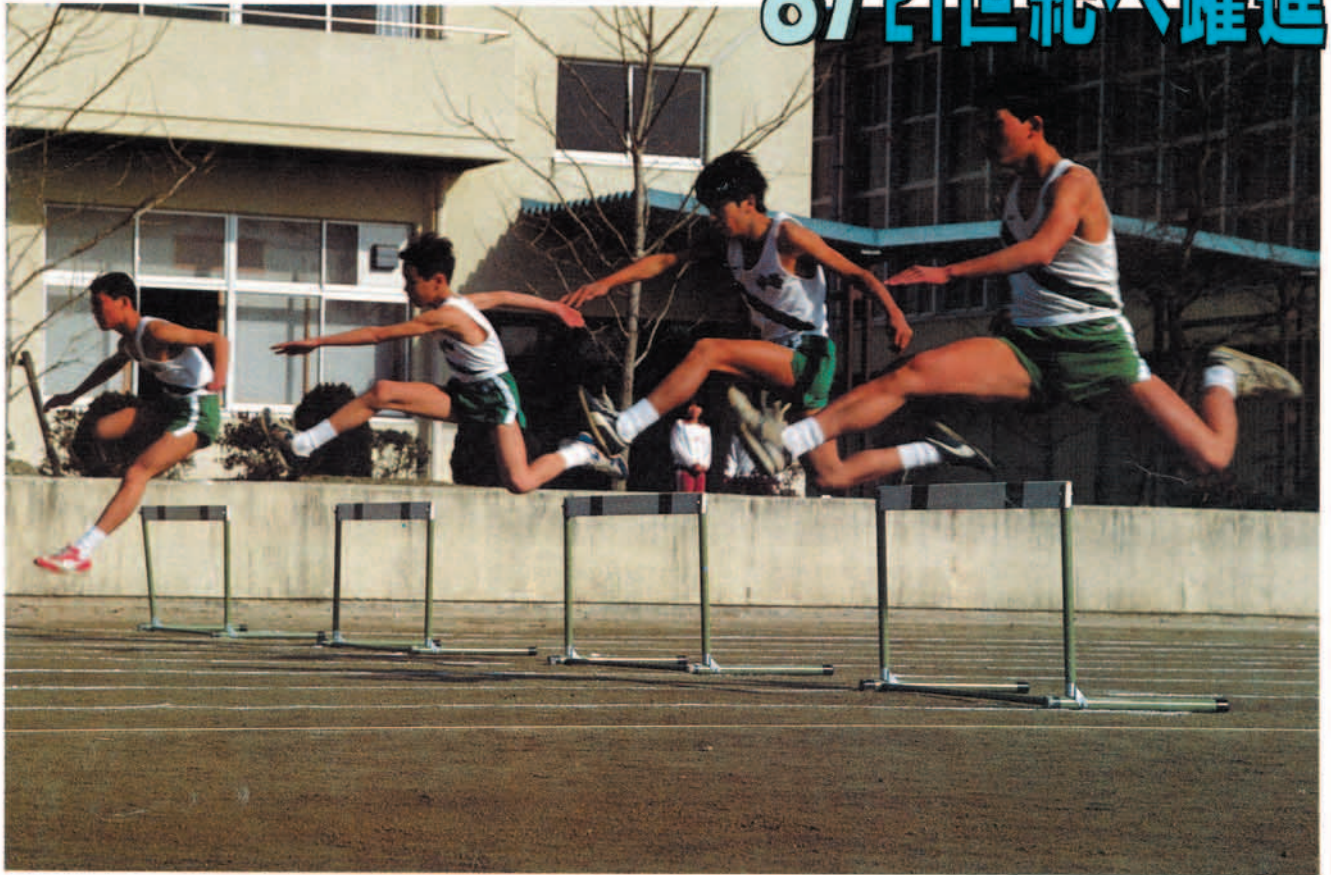
中谷中学校陸上部の選手たち