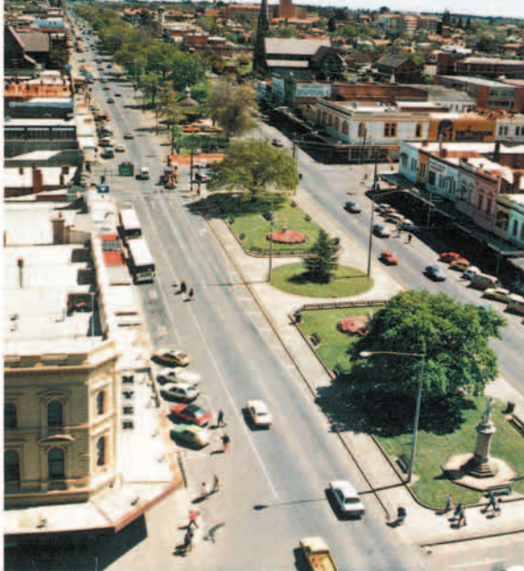
スタートストリート 東西に伸びる市の中央通り。公共施設・銀行などのビジネス街、デパートなどの商店街が通りに沿って広がっています。また、市を代表する建築物、彫像なども点在し様々な表情が見られます。

今月からは、バララット市の街並みや公園、小学校の授業風景など私たちが近づける近なものを紹介します。