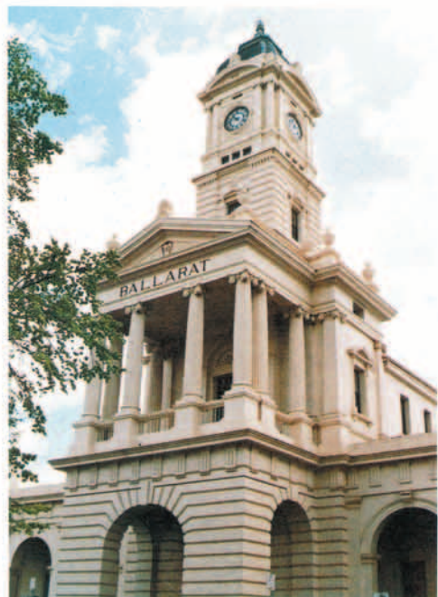
バララット駅 ビジネス街中心地の一角にあり、3階建ての時計塔は市民に時を告げる。建築技術だけでなく、19世紀の文化の粋も凝縮した、市を代表する荘厳華麗な建物です。