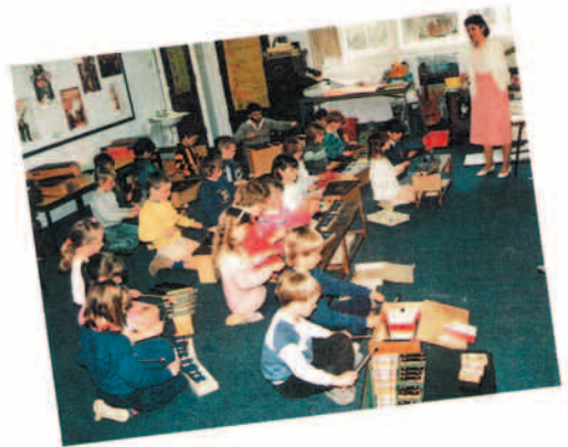
ダナ小学校の音楽の授業 市で古い学校の1つです。授業は月曜日から金曜日までで、1日6時間。宿題は日本ほどたくさんなく、週2時間日本語の授業があります。