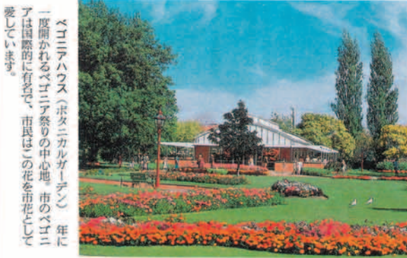
ペゴニアハウス(ボタニカルガーデン) 年に一度開かれるペゴニア祭りの中心地。市のペゴニアは国際的に有名で、市民はこの花を市花として愛しています。