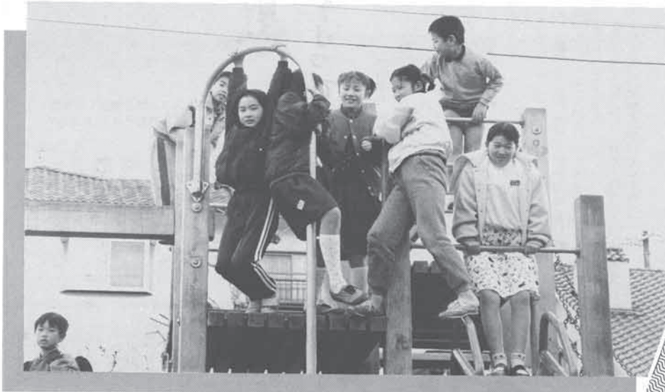
子供たちがのびのび育ち、心豊かに暮らせる町に

一般会計 54億8,500万円 特別会計 16億3,910万円 企業会計 14億1,165万円