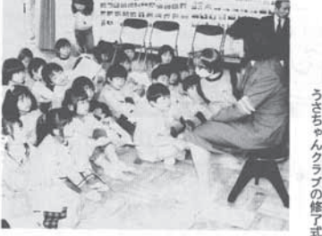
預名川幼稚園での修了式

交通安全クラブの修了式が行われた。 交通安全クラブの修了式が行われた。 交通安全クラブの修了式が行われた。