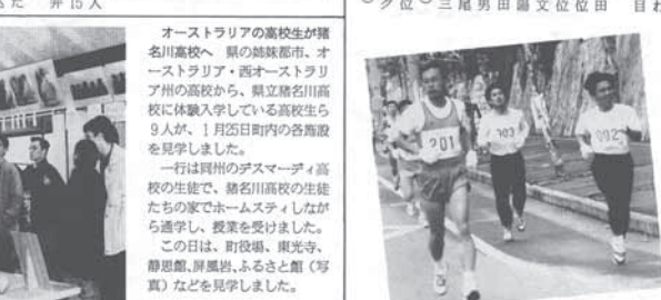
オーストラリアの高校生が猪名川高校へ、熊の熊鷹都市、オーストラリア・西オーストラリア州の高校から、県立猪名川高校に体験入学している高校生ら9人が、1月25日町内の各施設を見学しました。

町マラソン大会 1月20日、町マラソン大会が行われ、10名が参加しました。 参加者は、町民ら約100名です。 参加者は、町民ら約100名です。