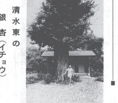
清水東の銀杏(イチヨウ)

●詳しくは、町長公室へ。 ●3月16日(木) 午後1時から同4時 ●3月22日(水)木津総合会館 ●3月29日(火)町民会館 ●詳しくは、町長公室へ。