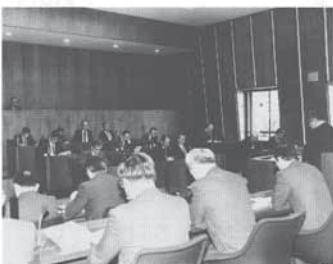
3月定例町議会の本会議場