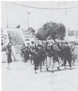
横断歩道は手を上げて、左右確認して渡りましょう

朝の出勤・登校時間は、同じ時間帯で人と車が道路を行き交います。子どもは交通事故のうち道路への飛び出しは、半分を占めています。特に四月は新入学の季節です。今年一度、交通安全について家族で話し合い、ドライバーも歩行者も、一人ひとりが責任を持って交通ルールを守り、交通事故をなくすよう努めましょう。 町内で交通事故が多発している。今年に入って、町内での交通事故は十一件発生しており、いずれも不注意や無謀運転が原因です。悲しい結果を招かないよう、ゆとりを持って安全運転に心がけてください。