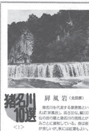
猪名川10選 屏風岩 (北田郷)