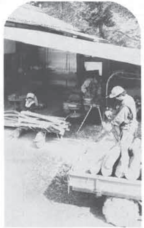
加味治通氏宅(概並)

差別解消へ向けて 第18回猪名川町同和教育研究会が、2月26日町民会館で開催されました。「教育内容の創造」と「差別解消への輪を広げる」を課題に、160名の参加者が各分科会に分かれ、研究討議を深めました。