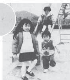
文化体育館の建設 町営住宅の建設