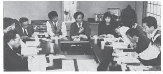
▼ 中学・高校分散会

差別解消へ向けて 第18回猪名川町同和教育研究会が、2月26日町民会館で開催されました。「教育内容の創造」と「差別解消への輪を広げる」を課題に、160名の参加者が各分科会に分かれ、研究討議を深めました。