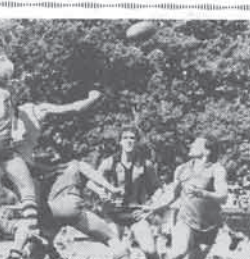
姉妹都市パララット市 オーストラリア

オーストラリアンフットボールゲーム 今回からこのコーナーで、姉妹都市のパララット市や市民と関係深いものについて紹介します。このゲームは1858年ピクトリア州で始まり、パララット市でも老若男女を問わず、最も人気のあるスポーツです。市民は防具なしで激突する選手たちの雄姿にエキサイトします。この競技は、18人ずつの2チーム間で楕円形のボールを蹴って、相手方のゴールラインを越して得点を競う球技です。