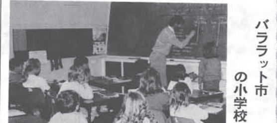
バララット市の小学校 市内には公立・私立合わせて42の小学 校があり、児童たちはバス、徒歩、自転 車、車の送迎などで通学しています。 1クラスの児童数は20名から30名程度 です。授業は週5日、午前9時から午後 3時30分まであり、国語、算数、社会、 理科、美術、音楽、体育を勉強しま す。年に2・3回父兄の参観日もあり ます。 12月から1月にかけて6週間、4 月・7月・9月中にそれぞれ2週間 ずつの休みがあります。

どの相談に応じます。 ▽とき 6月14日(水)午 後1時から同4時 ▽ところ 日生住民セン ター ◎行政相談 行政相談員が、国・県・ 町に対する苦情や要望など の相談に応じます。 ▽とき 6月15日(木)午 後1時30分から同4時 ▽ところ 日生住民セン ター