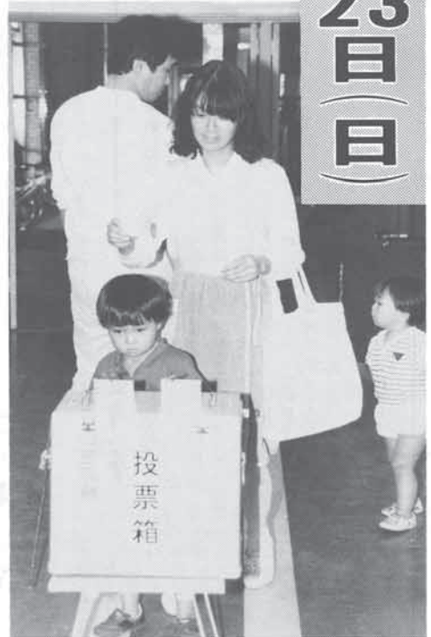
猪名川町議会議員選挙の投票風景(昭和62年9月27日執行)

は、町役場大会議室から猪名川小学校体育館(柏梨田)まで。当日入場券を失ったりし、照に変わりますので、ご注意ください。