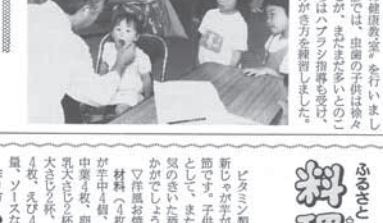
△後の健康教室 6月23日、保健センターでの健康教室。お楽しみ会を行いました。

非核・平和都市宣言を決議 6月定例会 6月15日(土)定例会 6月16日(日)定例会