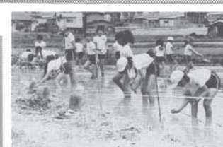
△大島小、田植えの体験学習 大島小学校5年生(54名)が、6月5日に田植えの体験学習を行いました。