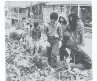
大野アルプスランドで植樹 町生活文化社会推進協議会の子供たち約130人が、11月19日大野山でアジサイの苗木約500本を植樹しました。

猪名川美術展 日生サビエで11月13日から開かれた猪名川美術展に、会員21人の油絵・日本画・彫刻など作品55点が展示されました。