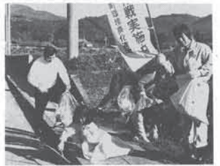
クリーン作戦 11月19日、町内各地でクリーン作戦が行われ、約9トンのゴミが集められました。