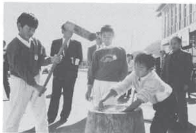
陽津小の勤労生産学習の発表会 10月24日(火) 文部省の「勤労生産学習研究推進校」に指定された陽津小学校で、生徒・先生・父兄・その他関係者ら約240人が集まり、モチつき大会(写真)や研究と実践の発表会を行いました。

(仮称)肝川住宅地の市街化区域の編入説明会 川地区など)の八九・五移を市街化区域に編入する予定。この区域は前回の線引変更時に近い将来市街化区域として開発することが適当な地区(特定保留地)町都市計画課へ。