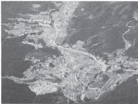
林田、笹尾方面を望む

当日域内の村々に、中世ではどれほどの家数があったか。それを知る材料として多田神社文書のうち、応安元年(一二六八)の金堂造営料棟別銭注文と永和元年(一二七五)の諸堂棟別銭注文がある。多田院の建物を造営するための費用を、多田内村の村々の棟別に課した時の目録である。一家一棟というわけではないからこの数がそのまま戸数とはいえないが、大よその目安にはなる。外が応安、内が永和の数。一は記載なし。北から並べてみる。